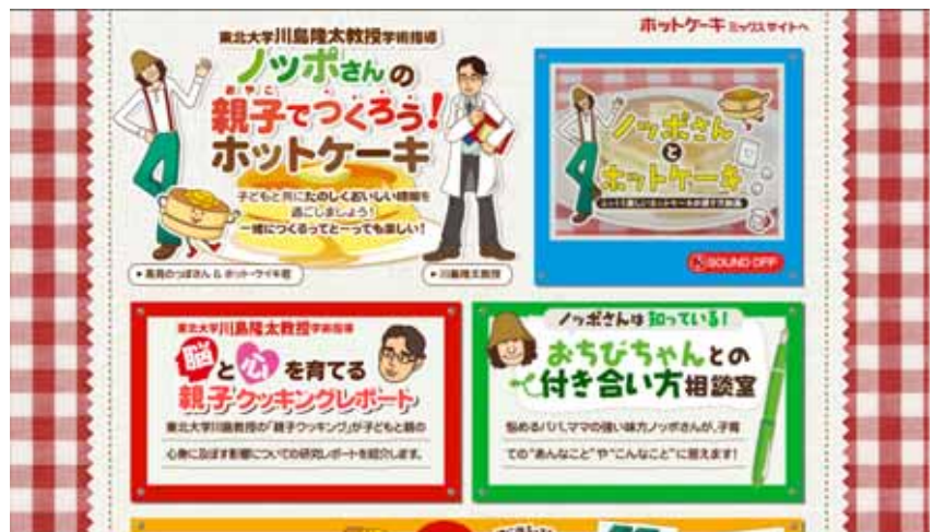
ホットケーキホームページ ( http://www.morinaga.co.jp/hotcake/ )