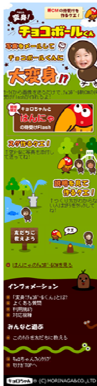
『変身!チョコボールくん』サイト TOP