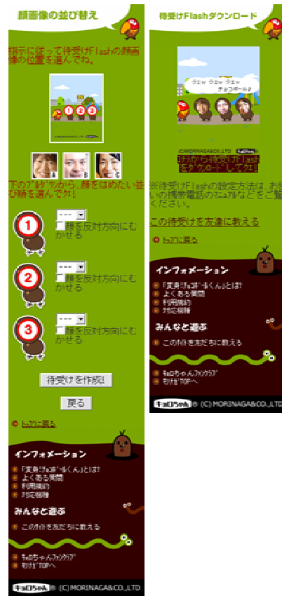
待受け Flash 作成画面