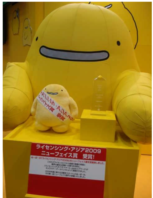
▲ニューフェイス賞受賞