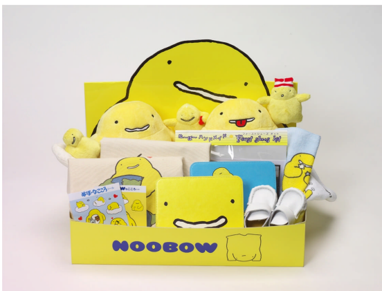
▲先行ライセンス商品