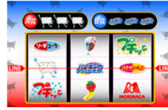
▲ハイチュウくんスロット