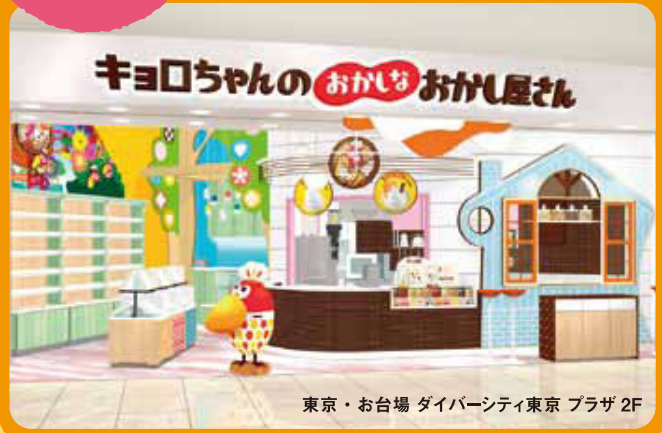
東京・お台場 ダイバーシティ東京 プラザ 2F