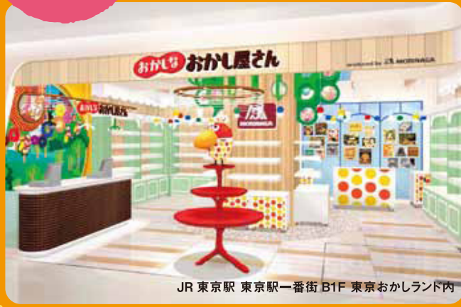
JR 東京駅 東京駅一番街 B1F 東京おかしランド内