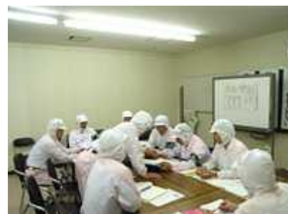
内部監査(塚口工場)

この監査では法規制順守やシステムの運用状況はもとより、特に環境パフォーマンスを重視しておこなっています。